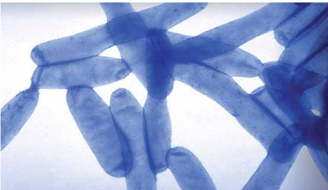
Abb.: Legionellen, stark vergrößert.

Spätestens seit dem Legionellose-Ausbruch in Warstein im August/September 2013 mit 165 Erkrankten und drei Todesfällen ist jedem Betrieb, der Rückkühlwerke betreibt, klar, dass er ein besonderes Augenmerk auf die gewissenhafte Desinfektion seines Kühlturmwassers richten muss, um eine Umgebungskontamination mit humanpathogenen Mikroorganismen zu verhindern.